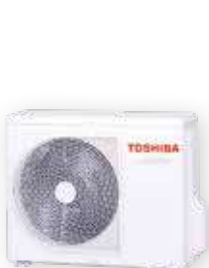
Vonkajšia jednotka (symbolické znázornenie)