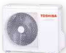
Vonkajšia jednotka (symbolické znázornenie)