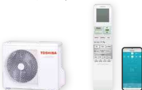
Vonkajšia jednotka (symbolické znázornenie)