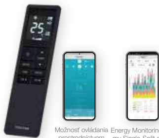
Možnosť ovládania Energy Monitoring pre systémy Single-Split a Multi Next prostredníctvom aplikácie Komfortné infračervené diaľkové ovládanie s podsvieteným displejom a týždenným časovačom