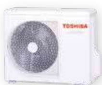
Vonkajšia jednotka (symbolické znázornenie)