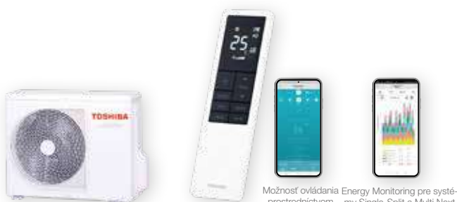
Vonkajšia jednotka (symbolické znázornenie)

Daiseikai 10 prináša inovatívny dizajn, vysokú účinnosť a maximálny komfort. Určite sa oplatí nielen na chladenie alebo vykurovanie. Pohyb a čistenie prebiehajú na najvyššej úrovni, systém Smart Sensing rozpoznáva pohyby osôb a riadi klimatizáciu individuálne podľa kritérií pre komfort a účinnosť.