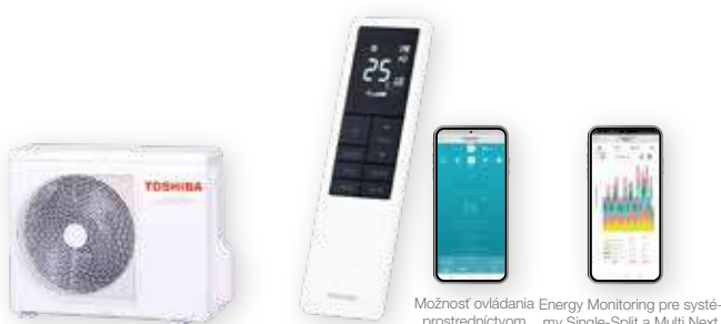
Vonkajšia jednotka (symbolické znázornenie)