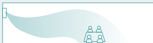
Simulačný test 3D

Daiseikai 10 využíva špeciálne tvarované klapky výstupu vzduchu: nevedú ochladený vzduch priamo preč z jednotky, ale dlhým oblúkom pozdĺž stropu, odkiaľ potom rovnomerne klesá. Týmto spôsobom sa zabráni nepríjemnému pocitu prievanu.